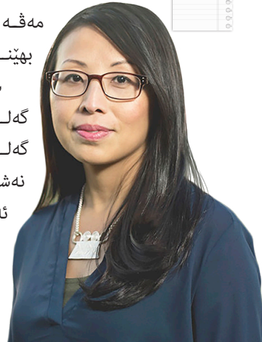
مەي دېر فانك

مەفە بۆ بەيئە فەگۆھاست و لدەف بەيئە ھەلگرتن.